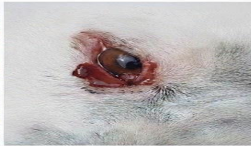
DIAGNÓSTICO: LESIÓN OCULAR