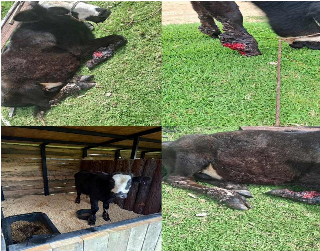
Rescate de ternero en mal estado de salud. Se brindó tratamiento médico y cuidado.