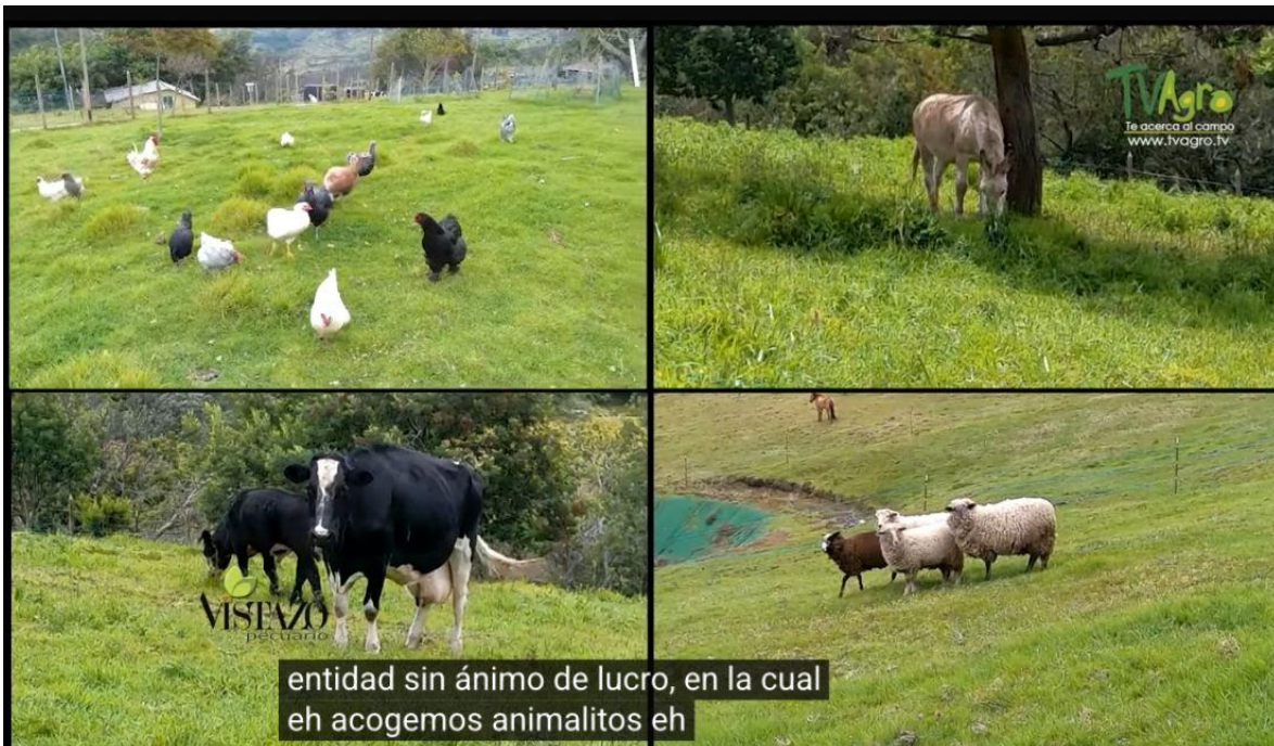
entidad sin ánimo de lucro, en la cual eh acogemos animalitos eh